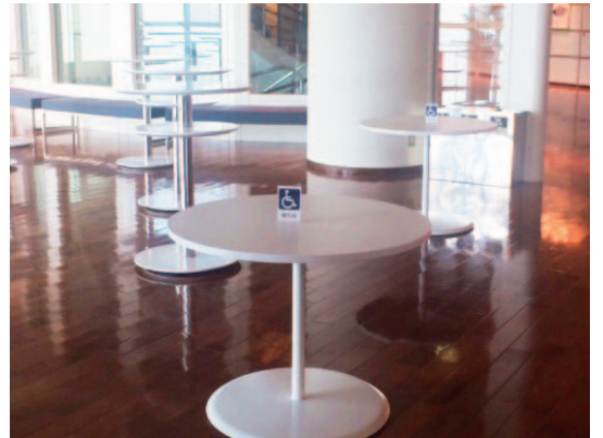
▲車いすご利用の方やお子様ご利用しやすいよう、ローテーブルを導入。