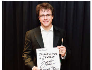
マエストロ：ヤクブ・フルシャ 「このホールは、宝石！」とお褒めのサインをいただきました！