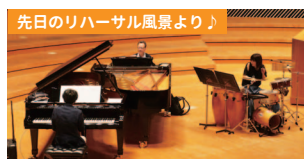
at ドリンクコーナー

ミュージア川崎シンフォニーホール オルガン、ピアノ / ルドルフ・ルッツ & 佐山雅弘 ほか