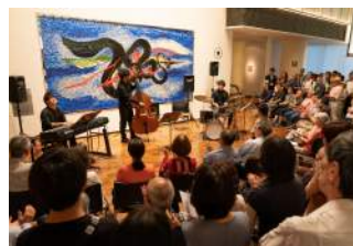
若手ミュージシャンのロビーコンサートも大盛況!