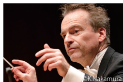
ジョナサン・ノット