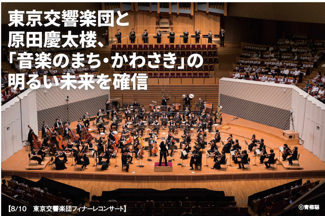
【8/10 東京交響楽団フィナーレコンサート】