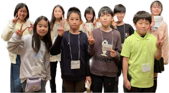
(ジュニア・プロデューサー2023のメンバー)