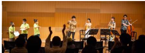
過去のジュニア・プロデューサー公演の様子