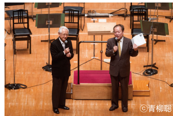
開演前のプレトーク(秋山和慶・奥田佳道)