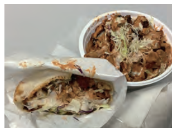
ケバブサンド500円、ケバブ丼500円

サマーミュージア公式サイト https://www.kawasaki-sym-hall.jp/festa/