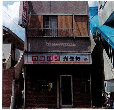
桐朋学園前の光生軒は、昔のままの佇まい。多くの音楽家の成長をさりげなく見守ってきました。