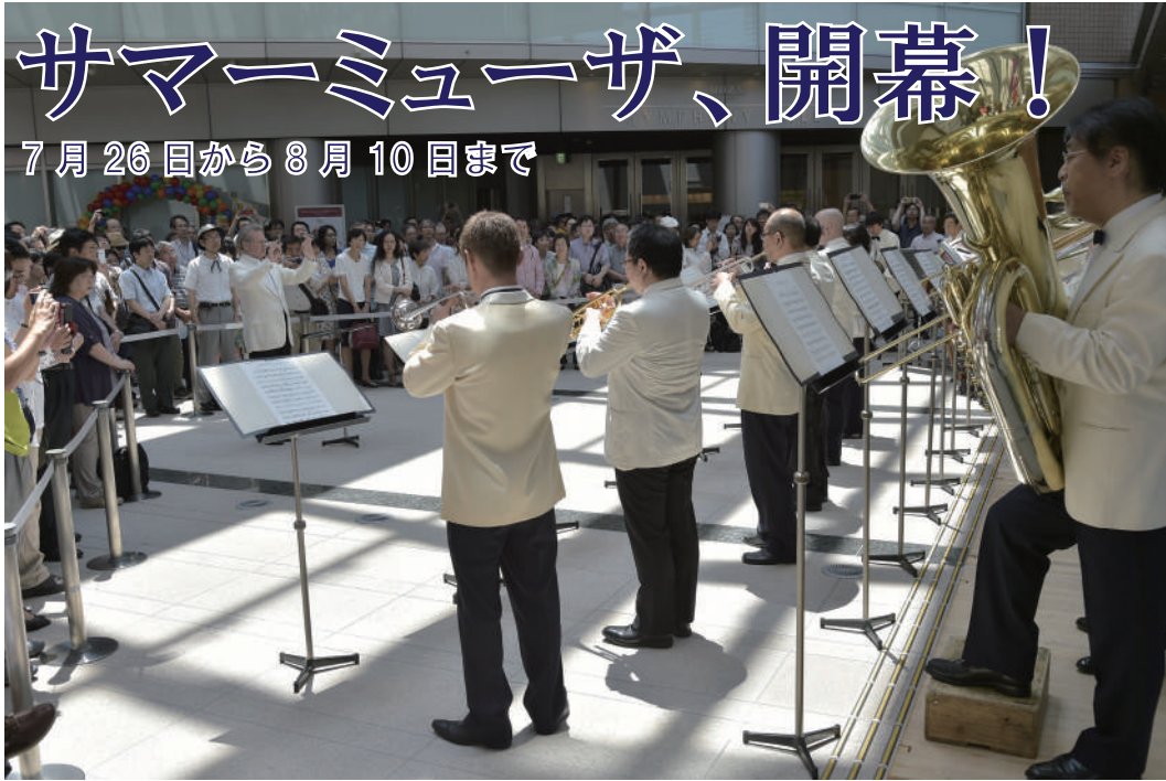
本日 (7/26) 11時スタートのオープニングファンファーレの様子

今年もフェスタサマーミュージックが始まります。ついに2ケタ、10回目!そしてホールは開館10周年!参加するプロオーケストラも10団体!10にちなんだ今年のテーマは、「十人十色の楽しみ方」ということで10人のモデルが参加。テーマカラーの白に「真っ新たな気持ちで再スタート!」の気持ちを込め、デザインを一新した白いポスターやパンフレットが、今年のサマーミュージックの目印となっています。そして、一般の方からもモデルを募集、老若男女誰もがこのサマー