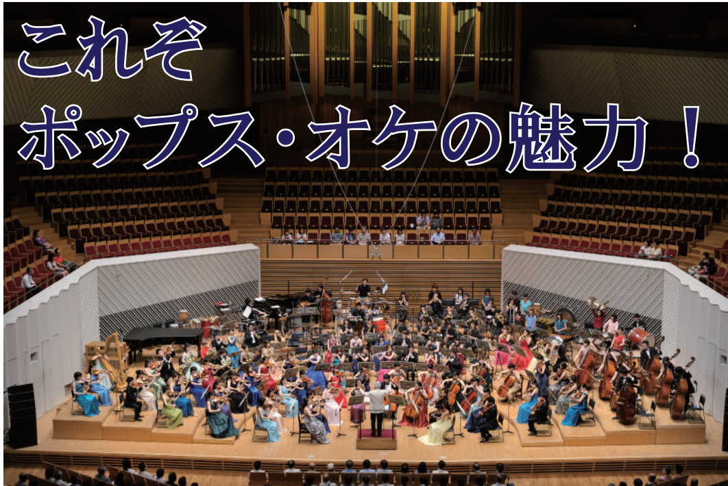
7月28日(月) 洗足学園音楽大学

第1部 はオーケストラ、 第2部 はビッグバンド、 第3部 は両者の共演、という盛りだくさんのプログラム。第1部は秋山和慶の指揮で、「ウエストサイド物語」より「シンフォニック・ダンス」など。実は重たい演奏になりがちな難物を、推進力のあるテンポで駆け抜ける。第2部は23名編成のビッグバンドで「ピノッキオ」など3曲を演奏、充実したサウンドを披露した。数多くの打楽器を駆使、さらにヴァイオリンなど通常はビッグバンドに含まれない楽器も採用、色彩豊かな音