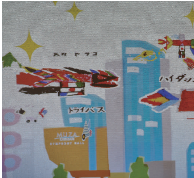
ぬりえが動き出す!