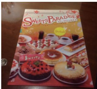
チケット提示でもらえるファイル

スイーツパラダイス 川崎DICE6階 総合プログラムP.91 パートナーショップガイドP.11