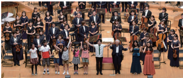
ウェルカム・コンサートでナレーションを務めた子どもたちに拍手喝采