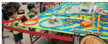
鉄道イベントも大にぎわい

川崎市の市制記念日、7月1日に、ミュージアビル全体で行われた夏祭り「ミュージアの日」特別レポートをお届けします。