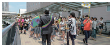
パレードで練り歩く