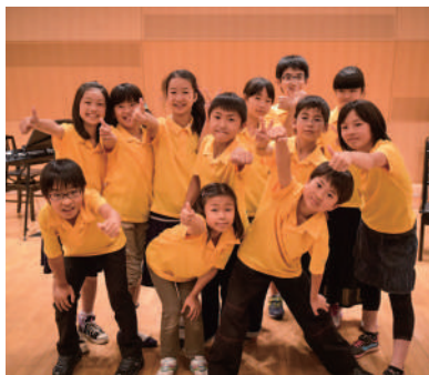
終演後のジュニア・プロデューサーたち