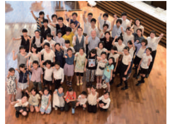
終演後、みんなで記念撮影!