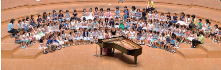
8月6日(土) イツ・ア・ピアノワールド