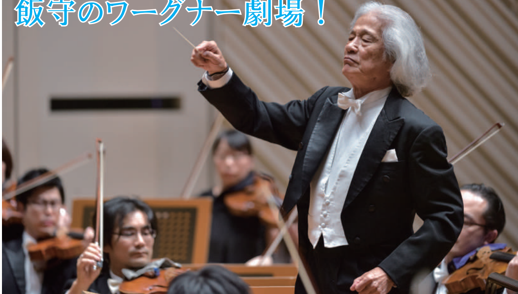
8月10日(水) 東京シティ・フィルハーモニック管弦楽団「ドイツ音楽の神髄! 飯守泰次郎のワーグナー」

フェスタサマーミュージック8月10日に登場したのは東京シティ・フィル。指揮はかつての同団常任指揮者で現在は桂冠名誉指揮者の地位にある飯守泰次郎、深い信頼関係で結ばれてきた名コンビである。プログラムのメインは飯守の十八番であるワーグナー作品。会場には「飯守のワーグナー」を目当てに駆け付けたワーグナー・ファン、飯守ファンも多く見受けられた。