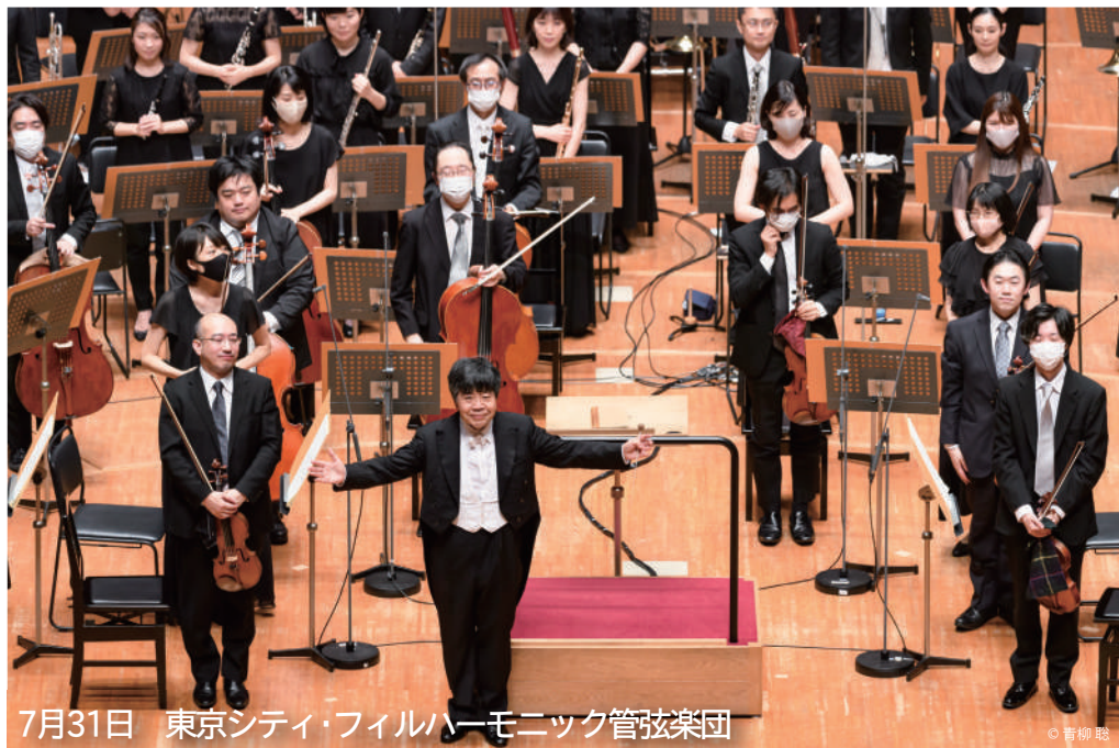
7月31日 東京シティ・フィルハーモニック管弦楽団