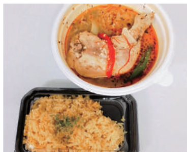
10種の野菜とチキンレッグのスープカレー(税込1,155円)

ミュージアのすぐそば、川崎ルフロンの無添加スープカレー&スパイスカレーCOSMOSで10種の野菜とチキンレッグのスープカレーをテイクアウト。もちろん店内で食べることも可能です。辛さは小辛と中辛と辛口から、ライスの量は普通と大盛から選ぶことができます。今回はライス普通の中辛で注文。