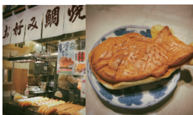
冷たい鯛焼き チョコ200円/レアチーズ200円/ シャインマスカット230円

フェスタサマーミュージア公式サイト https://www.kawasaki-sym-hall.jp/festa/