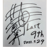
井上道義 マエストロ のサイン