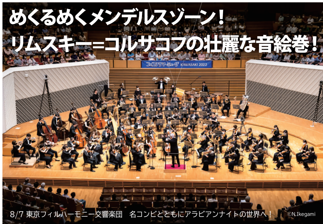
8/7 東京フィルハーモニー交響楽団 名コンビとともにアラビアンナイトの世界へ！

今 年の「フェスタサマーミュージックKAWASAKI」の東京フィル公演の指揮者はダン・エッティンガー。現在同団の桂冠指揮者である彼だが今回の共演は3年ぶりとのこと、久々の再会で相当気合が入っていたのだろう、非常に白熱した演奏会(完売公演!)となった。