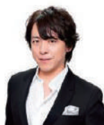
ナレーション:宮本益光