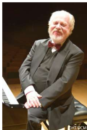
ピアノ：ゲルハルト・オピッツ