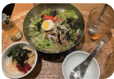
牛焼肉とたっぷり野菜冷麺セット (税込1,250円)