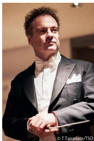
指揮：ジョナサン・ノット