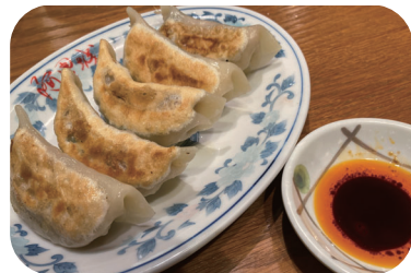
手作り黒豚焼き餃子(5個入り) 580円(税込)638円