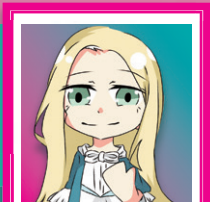
アルマヴィーヴァ 伯爵夫人