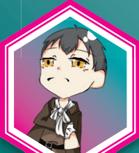
アルマヴィーヴァ 伯爵