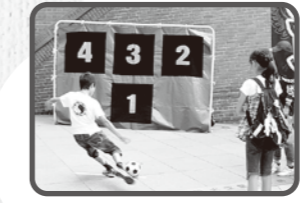
*雨天・荒天時には屋内へ場所を変更して行います。

フロントレグズが当たっちゃう♪ ガラポン!! 場所 2階 ゲートプラザ 時間 13:00~16:00 協カ=川崎フロントレ